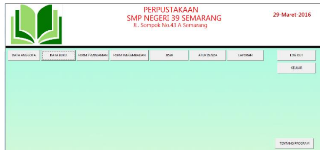
Gambar 2. Tampilan Menu Utama

Pada tampilan menu utama akan terlihat beberapa akses-akses yang telah tersedia yang berisikan beberapa Menu hak Akses seperti Menu Data Anggota, Data Buku, Form Peminjaman, Form Pengembalian, User, Pengaturan Denda, Laporan dan Logout