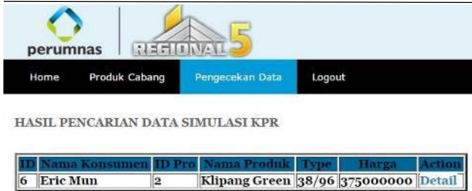
Gambar 4.22 Tampilan Hasil Pencarian dari Pengecekan Data Simulasi KPR