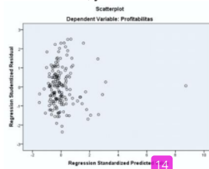
14 Gambar 3. Grafik Scatterplot Uji Heteroskedastisitas

Untuk menguji apakah varians residual (kesalahan data) berbeda secara signifikan antar observasi, maka dilakukan apa yang disebut "Uji Heteroskedastisitas". Heteroskedastisitas tidak boleh ditemukan dalam model regresi. Hasil pengujian heteroskedastisitas, yaitu: