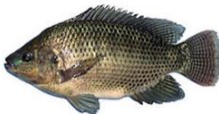
Gambar 2. Ikan Nila ( Oreochromis niloticus )