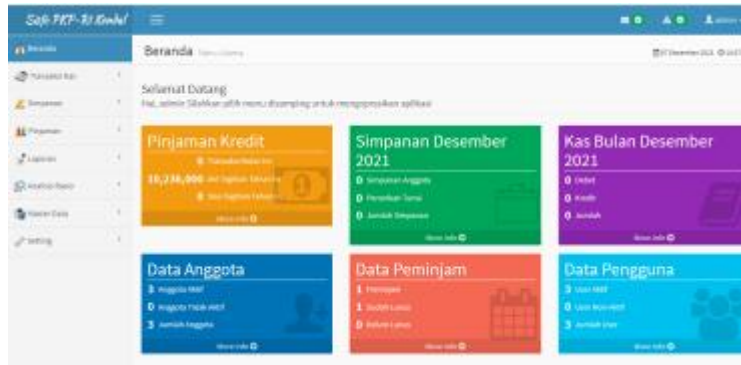
Gambar 3. Halaman Awal